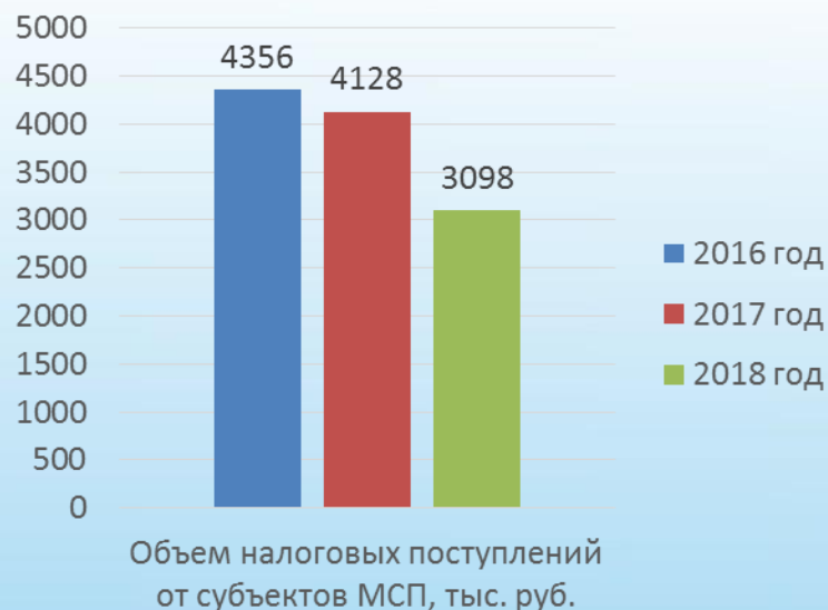
Объем налоговых поступлений от МСП, тыс. руб.